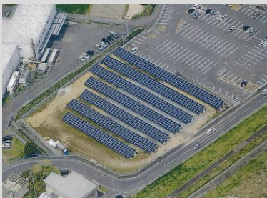
設置場所：香川県丸亀市 発電容量：300kW