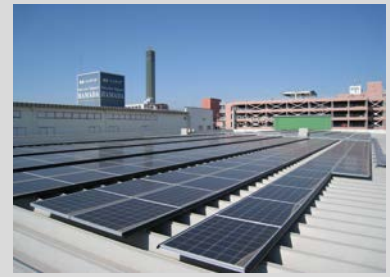
設置場所：香川県宇多津町 発電容量：190kW