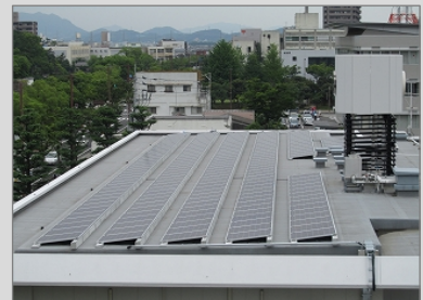
設置場所：香川県丸亀市 発電容量：48kW