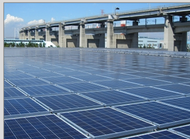
設置場所：香川県宇多津町 発電容量：250kW