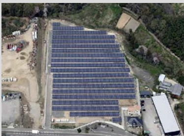
設置場所：香川県坂出市 発電容量：1,000kW