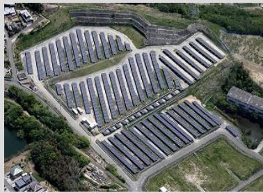
設置場所：香川県丸亀市 発電容量：1,500kW